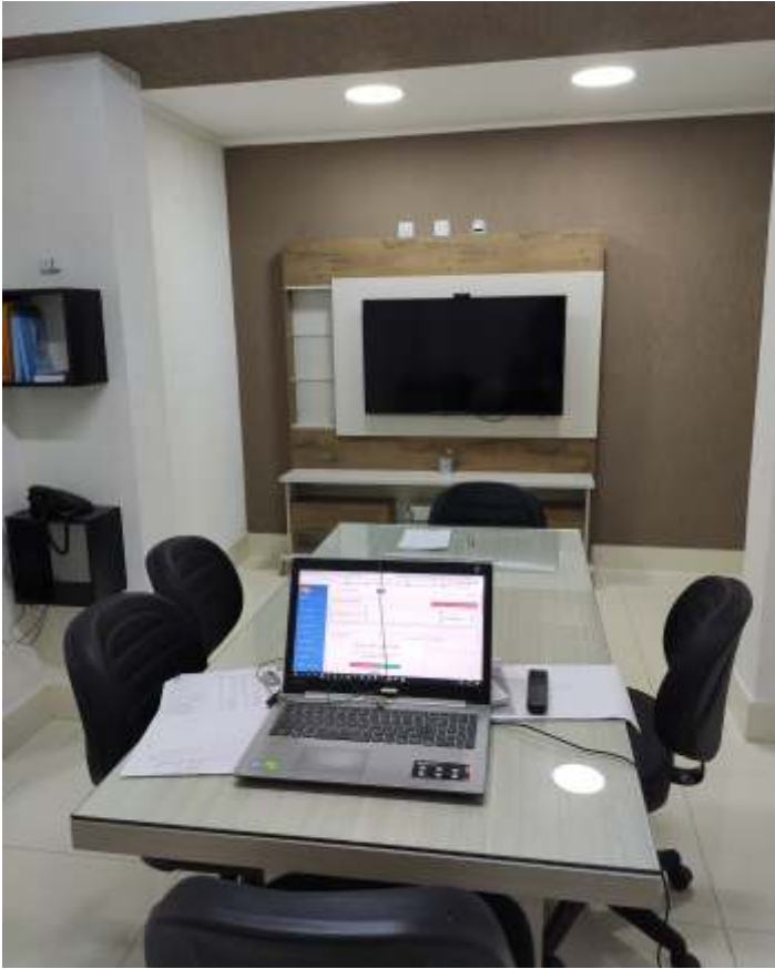
Sala de Videoconferência construída para reuniões em geral e dos Conselhos Deliberativo e Fiscal.

Zelar pela infraestrutura patrimonial e garantir a segurança documental foi a principal motivação que levou a atual Diretoria Executiva da Fundação a mais um investimento de grande importância.