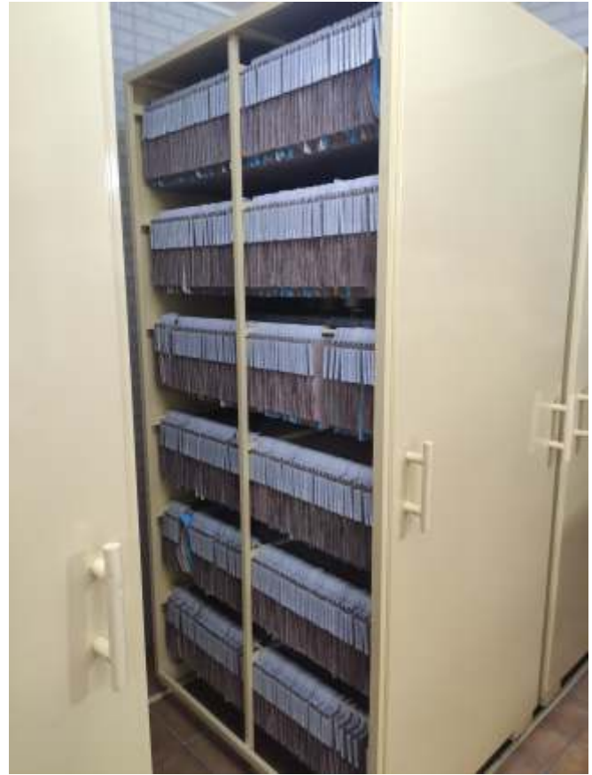
Sala de Arquivo Geral totalmente reestruturada, com armários e pastas novas.

Oferecer um ambiente de trabalho adequado aos Empregados da Fundação com maiores condições de produtividade, zelar pela infraestrutura patrimonial e, garantir a segurança documental, são algumas das razões que levou a atual Diretoria Executiva da Fundação a mais este investimento na Prevsan.